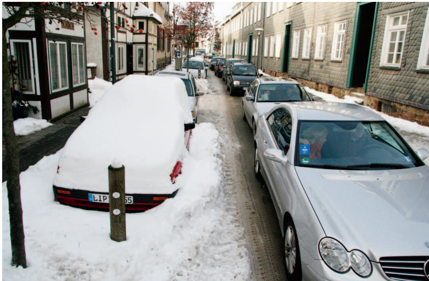
Nichts geht mehr: Die Straße Rampendal gestern Mittag. Weiter vorne blockiert ein falsch geparktes Auto den Stadtbus-Verkehr. Der Rückstau reicht bis zur Herforder Straße. Jetzt hat die Stadt ein absolutes Halteverbot auf dem inneren Ring angeordnet.

Wie berichtet, hatten in den vergangenen Tagen mehrere parkende Autos die Durchfahrt für Stadtbusse blockiert. So geschehen beispielsweise gestern Mittag an exakt derselben Stelle